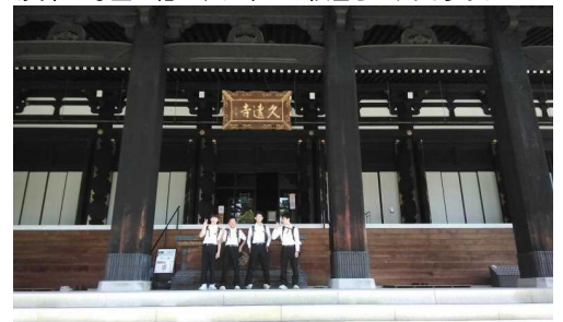
<身延山久遠寺の本堂は本当に大きいね!>