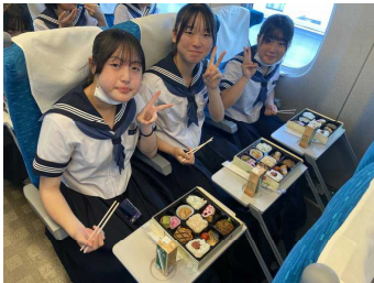
<新幹線内でお弁当です♪>

3年生のみなさんは、終始笑顔でほんとうに楽しい3日間を過ごすことができたようです。その中においても、仏像や建築、庭園などの歴史に触れる場面では、真剣にそして感慨深い表情で見入る姿が印象的でした。