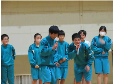
<クラスごとの出し物～盛り上がりました!>