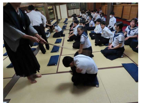
<強めてお願いします・・・バシッ！！>