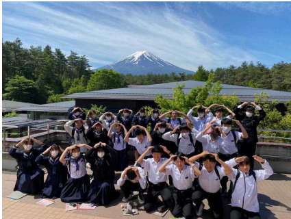
<きれいな富士山～みんなで富士山♪>

2年生は、5月15日に「ふるさと探訪」をおこないました。私たちの住む山梨について調べてきたことを自分で確かめて「わっ!!」と驚くような発見ができる旅にしたいというテーマのもと、甲府方面、昇仙峡方面、富士北麓方面、峡南方面、峡東方面、峡北方面にわかれて見学をしてきました。それぞれ、場所は違いますが、どのグループも有意義な体験をしてられました。