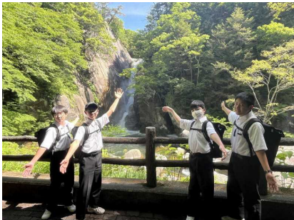
<滝でーす!。溪流でーす。>