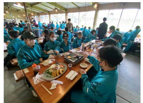
<みんなで食べるBBQはおいしいね>