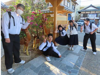
<宿舎に到着したよ～♪>