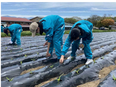
<苗植えは結構大変な作業だねえ>