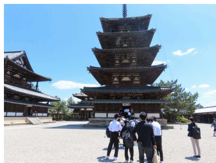
<1300年前から建っている塔なんだね～>