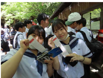
<末吉って良いの？悪いの？>