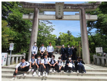
<武田神社～良い天気です!>