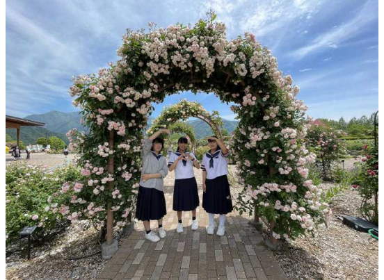
<爽やかな空&花のトンネルが似合う3人です♪>