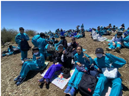
<頂上は気持ちいい～入笠山>

2日目は、滝沢牧場にて命の授業や乗馬体験、やぎや羊の餌やり、苗の植え付け、そしてBBQなど多くの体験をすることができました。