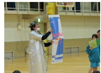
<GOD ウェスト マウンテン 降臨> 西山教頭:「君たちに翼を授ける!」