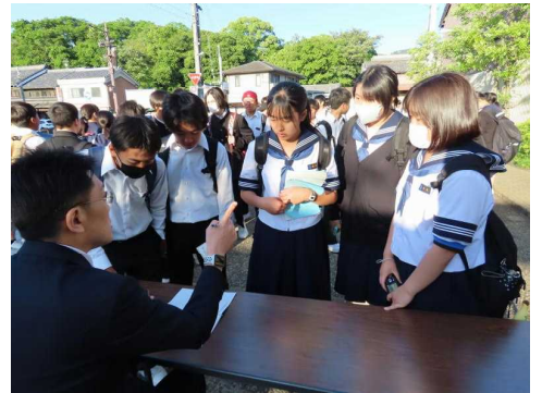
<古屋主任：グループまとまって来たかな？>