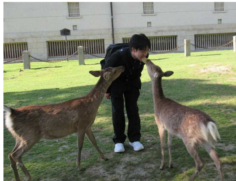
<シカ君！あわてないで食べてね！>